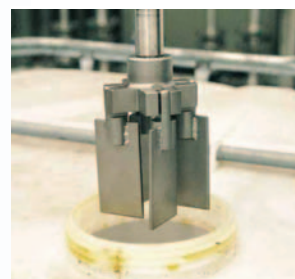
E-400 faltbares Flügelrad bei Anwendung