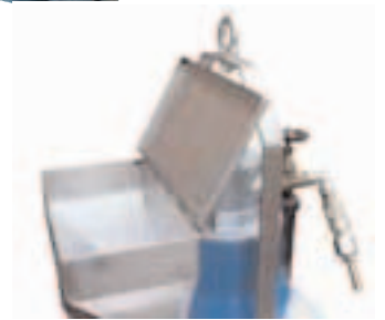
Modell mit Einfülltrichter

HBC - Hochgeschwindigkeitsdirektübertragung LBC - langsame Gangschaltung Motoren 0,37 - 1,5 kw elektrisch oder pneumatisch Extra Modelle sind erhältlich für die Eingebung von Pulvern oder Flüssigkeiten in den IBC. Verschiedene integrale elektronische Geschwindigkeitsregler sind erhältlich.